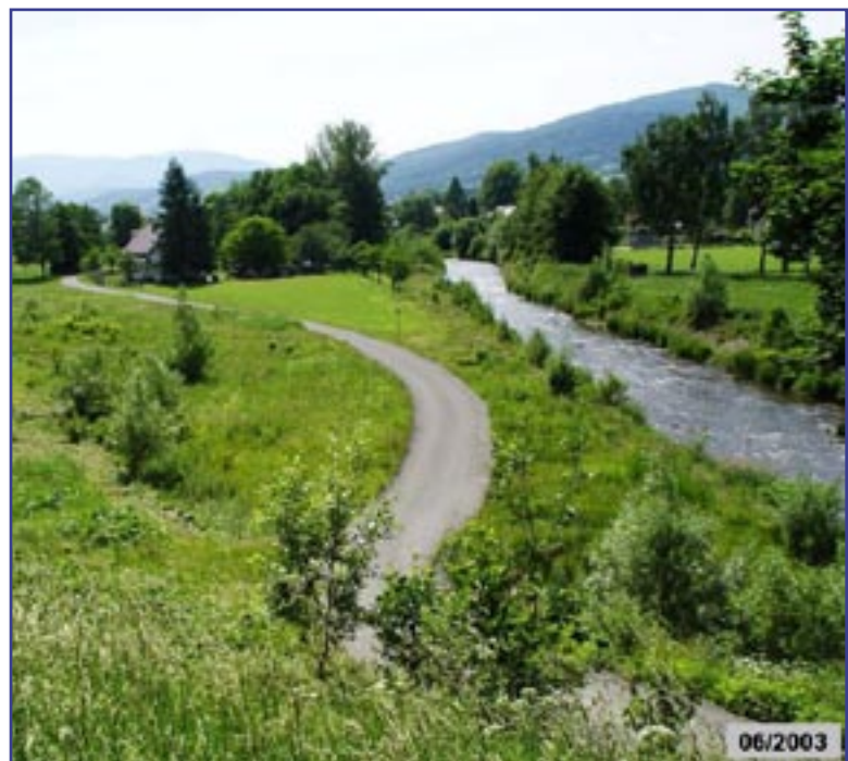
Jedná se o srovnání stavu těsně po povodni a po provedených úpravách v Písečné na Bělé.