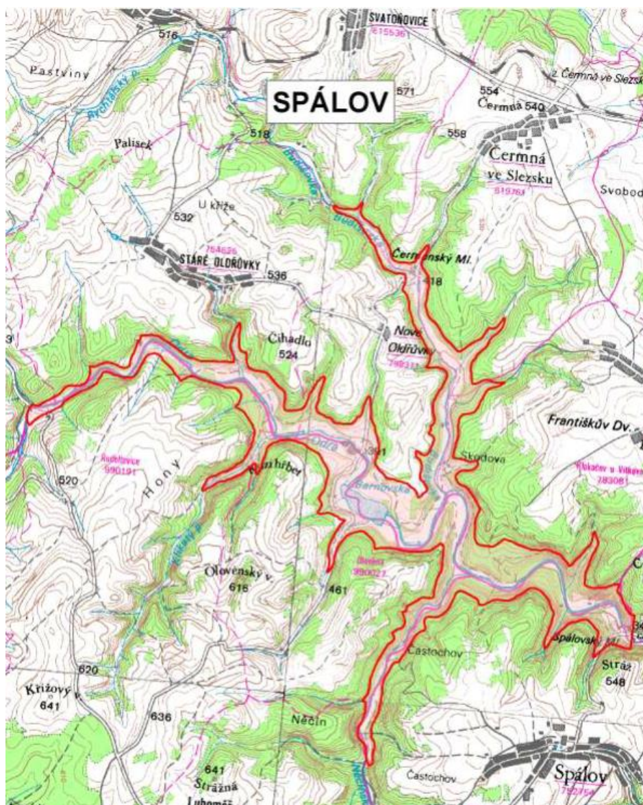
Obr. 2 Schéma plánované nádrže Spálov