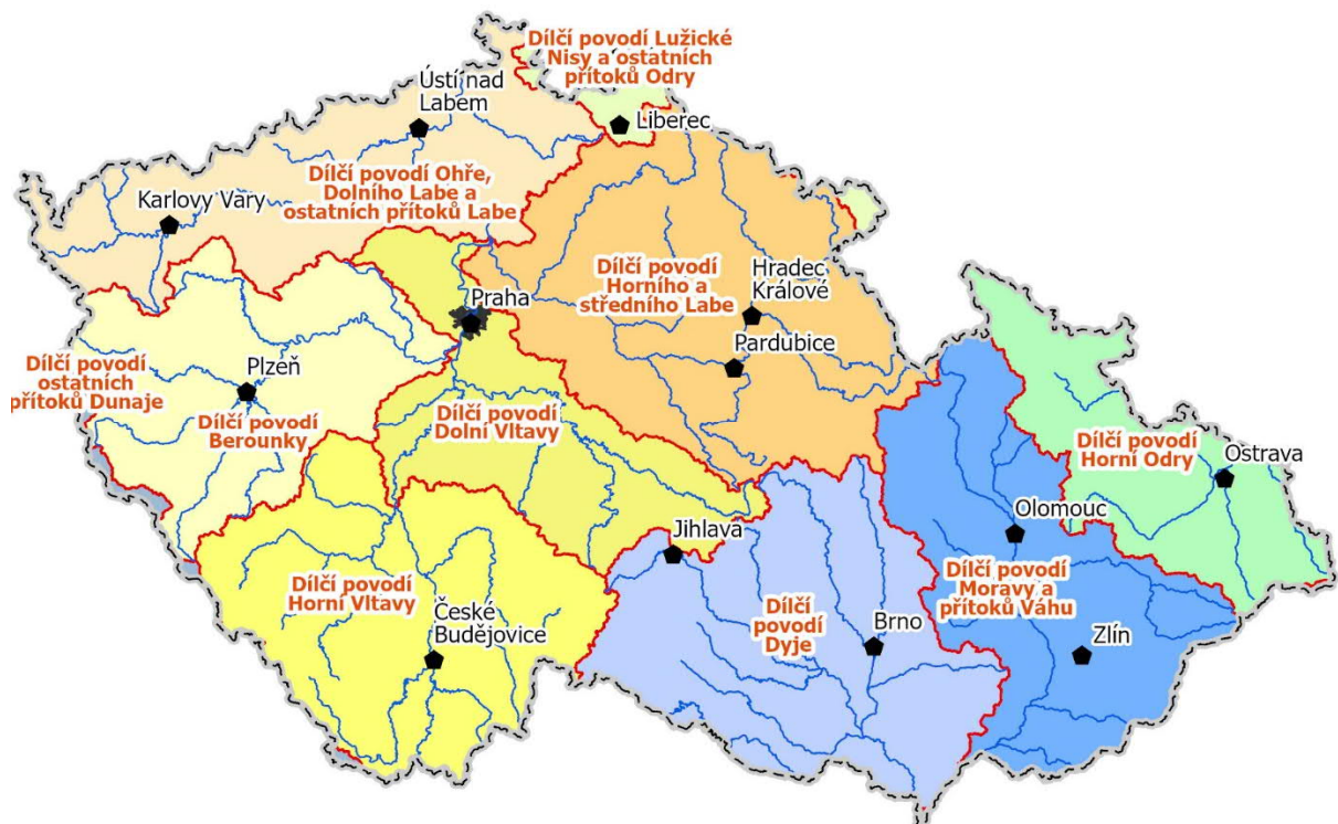
Obr. 1.2b - Dílčí povodí České republiky