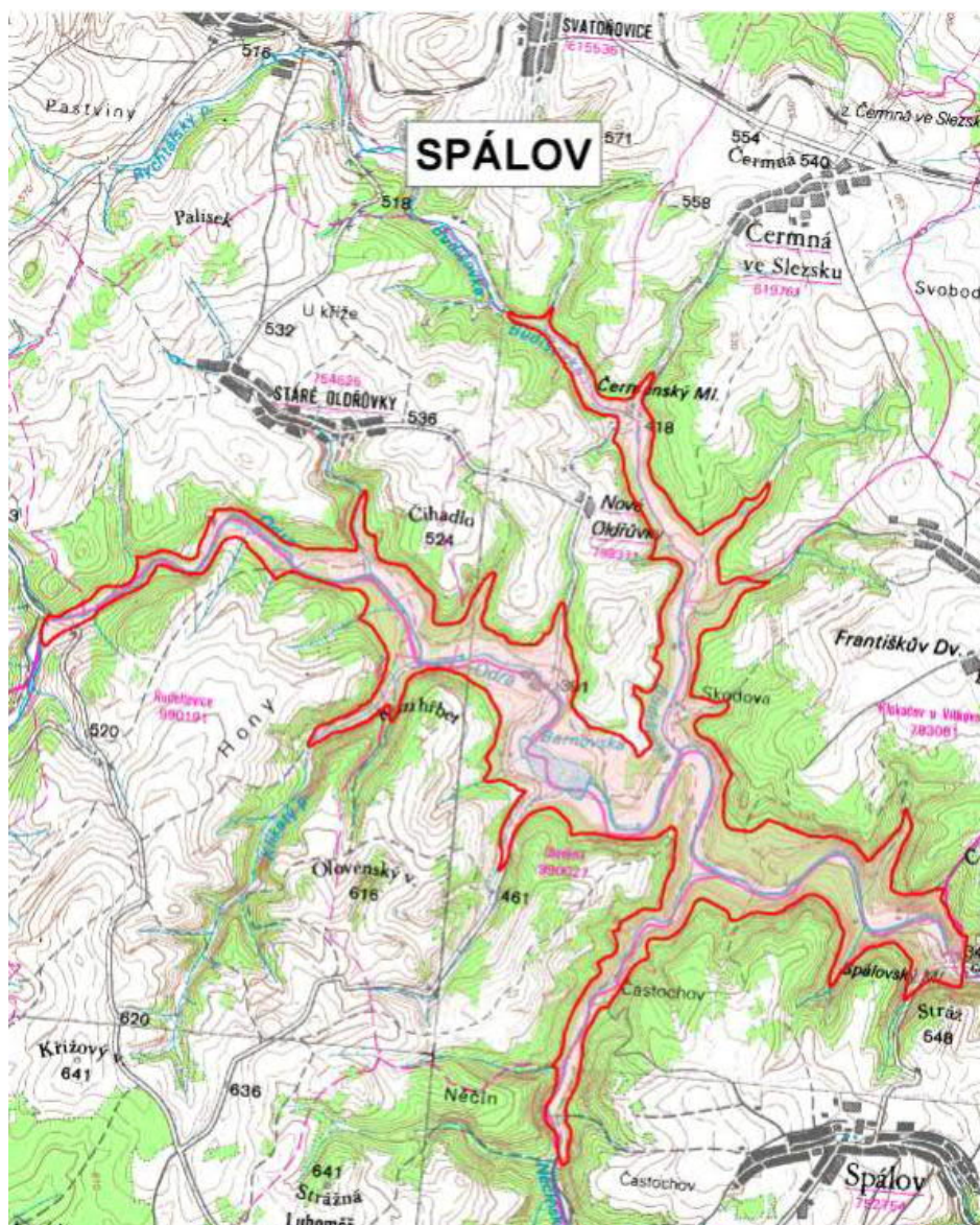
Obr. 2 Schéma plánované nádrže Spálov